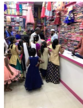
Een dagje uit..koopjes