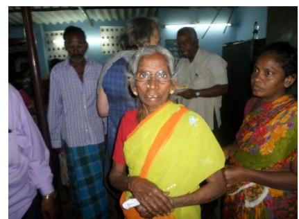
Wat staat de bril mooi